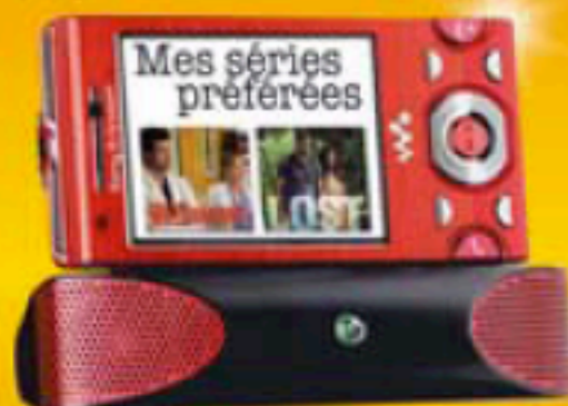
Modèle 6400 - 1200

4 épisodes de Lost et Grey's Anatomy embarqués 12 épisodes supplémentaires* à télécharger sur VISION