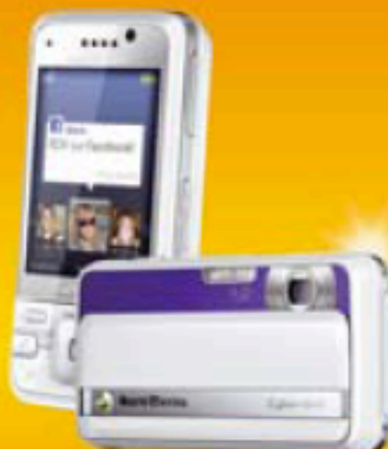
Modèle Cyber-6407 - 1200